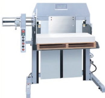
センター揃え可能(調整機能付)